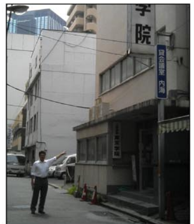
↑ 当日は番長が道案内いたします??